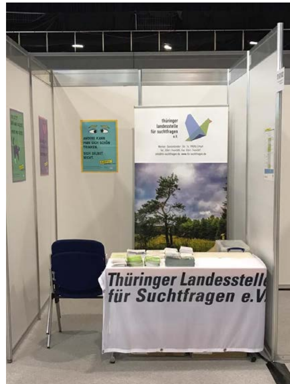
(Stand zur Gesundheitsmesse)

Der alljährliche Informationsstand im Rahmen der Gesundheitsmesse vom 16. bis 17.03.2019 innerhalb der Thüringen Ausstellung in der Messe Erfurt wurde von der Koordinierungsstelle thematisch gestaltet. Dabei lag neben der Sensibilisierung der Öffentlichkeit zu allen Abhängigkeitsproblemen auch ein großer Schwerpunkt auf den Substanzen Cannabis, Alkohol und Crystal Meth. Ein hohes Interesse der breiten Öffentlichkeit war auch in diesem Jahr deutlich spürbar. Durch die Verwendung der unterschiedlichsten Informationsmaterialien (Promilledrehscheibe, Faktenblätter, Substanzbroschüren, Kampagnenmaterial der Aktionswoche Alkohol, Rezepthefte zu alkoholfreien Cocktails etc.) wurden Gesprächsangebote zur gesundheitlichen Aufklärung gut angenommen. Diese Form der indirekten Weitergabe von Präventions- und Unterstützungsbotschaften hat sich in den vergangenen Jahren bewährt, da viele Besucherinnen und Besucher die direkte Kontaktaufnahme und Beratungsvermittlung am Informationsstand eher vermeiden.