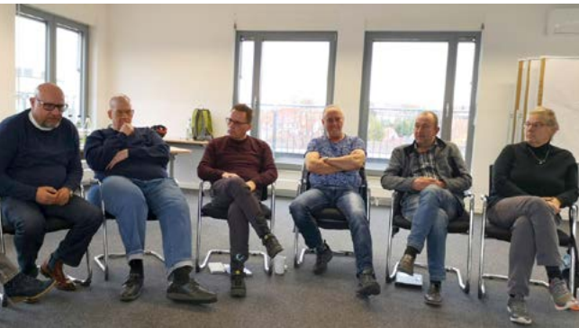
(Teilnehmende der Fortbildung)

Die Fortbildung für langjährig Aktive in der Suchtselbsthilfe oder wie die Teilnehmenden liebevoll genannt werden „alte Hasen“ hat am 09.11.2019 bei topmanagement in Erfurt stattgefunden. Insgesamt haben 11 Personen die Fortbildung wahrgenommen.