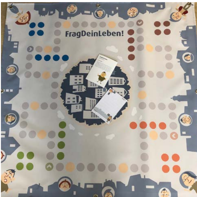
(Gruppenmethodisches Spiel: „Frag dein Leben“)

Die Qualität in den Gruppenangeboten für die Suchtselbsthilfe wurde durch das Spiel erhöht und unterstützt. Es wird als spielerischer Einstieg und als Gesprächsangebot für bestimmte Themen, aber auch für die Präventionsarbeit in der Selbsthilfe genutzt.