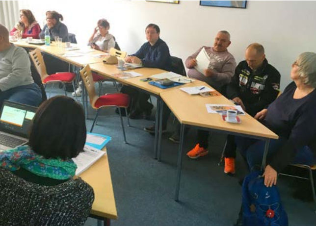
(Fördermittelschulung am 11. April in Erfurt)

wurde über Grundlagen der Fördermittelbeantragung und Nachweisführung bei den Rentenversicherungsträgern und den Krankenkassen und der Leitfaden zur Selbsthilfeförderung des GKV-Spitzenverbandes zur Förderung der Selbsthilfe gemäß § 20c SGB V für die Selbsthilfe informiert.