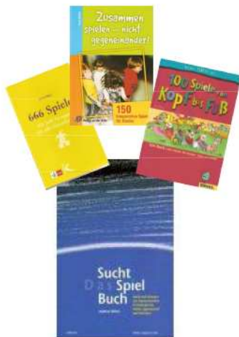
Sirko Schamel Diplom-Sozialpädagoge (FH)